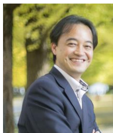
慶応義塾大学大学院 システムデザイン・マネジメント研究科