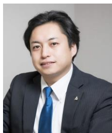
株式会社アオキシソテック