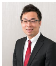
弁護士法人内田・鮫島法律事務所