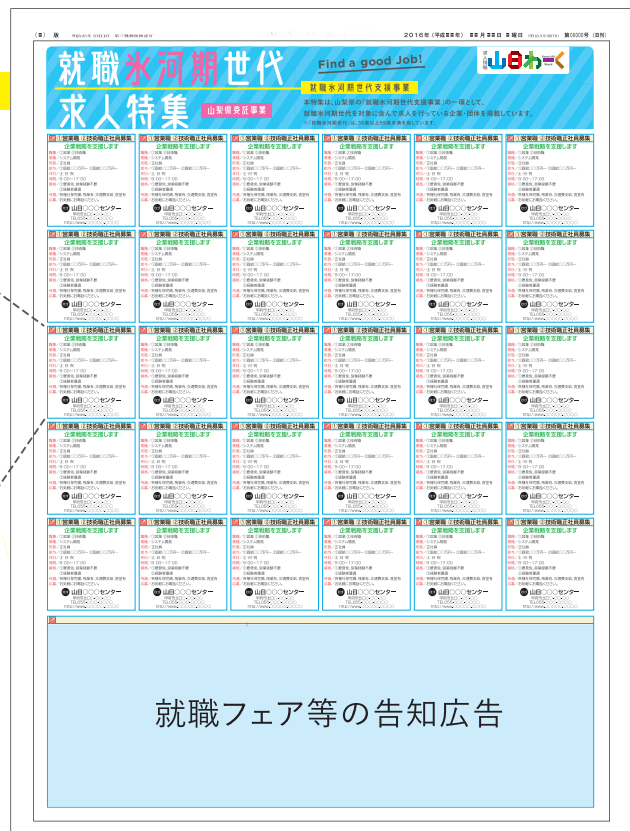
山梨日日新聞 特集イメージ ▶

【1社の掲載サイズ】縦62.2mm × 横61mm ※掲載規定(文字サイズ、内容等)がありますのでご了承ください。