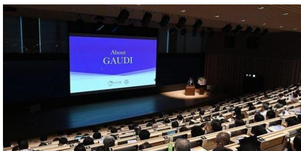
キックオフシンポジウムの様子

順天堂の誇る大規模臨床プラットフォーム（外来延患者数年間300万人以上、入院延患者数年間100万人以上）に迅速かつ容易にアクセスし、多様な研究開発を社会実装まで包括支援する体制を構築しています。