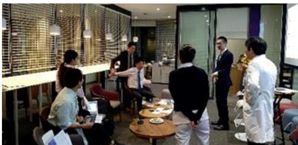
架け橋ピッチの様子